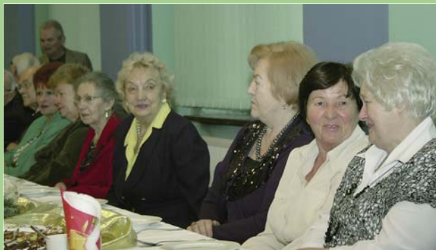
Spotkanie Lekarzy Emerytów w Delegaturze Bytomskiej (WSS nr 4 w Bytomiu)